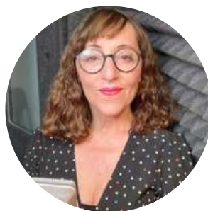
Vicky Tessio Voz Blog