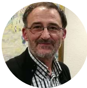
Josemari López Producción