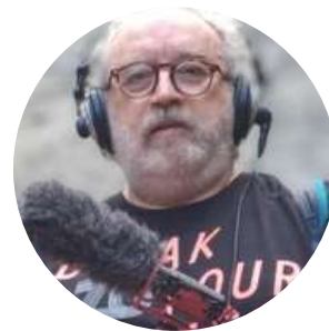
Chuse Fernandez Diseño Sonoro